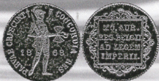
Dubbele Gouden Dukaat 1868 kabelrand met gepolijste stempels geslagen / RRRR, vermoedelijk uniek. Verkocht voor € 31.980

GALLAS | NEW YORK | BEVERLY HILLS | SAN FRANCISCO | CHICAGO | PARIS | GENEVA | IJSELSTEIN | HONG KONG