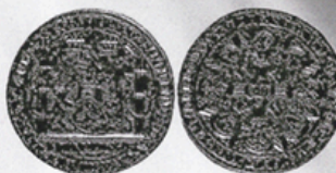
Louis de Maele Oude Gouden Holm (1346-84) Dalm 462 (R2), F-159, Gallard 216, Vernier 16 UNC-. Verkocht voor € 27.272