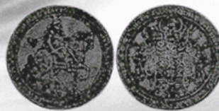
Brunswick-Wolfenbützel, Friedrich Ulrich 6 Taler 1620 (RN), Davenport LS44, KM228, XF45 NGC. Verkocht voor € 18.818