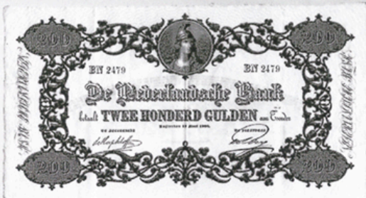
200 Gulden type 1860 model Reliëfrand 12-3-1908, ruim ZF/PR / RRRR Verkocht voor € 44.280